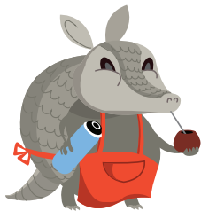
MATE Y TERMO