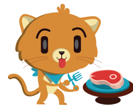
CUCHILLO Y TENEDOR