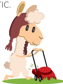
CORTADORA DE CÉSPED