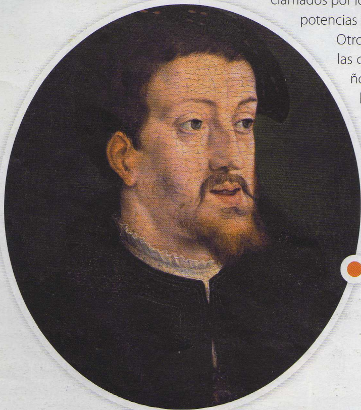
Carlos I de España (1500-1558), de la dinastía Habsburgo, era nieto de los Reyes Católicos y padre del monarca Felipe II (1527-1598). Durante sus mandatos, el Imperio colonial español logró su máximo esplendor.

Para hacer frente a estos intereses variados, la Corona española creó una serie de instituciones políticas, algunas localizadas en el nuevo territorio y otras, en la Península Ibérica.