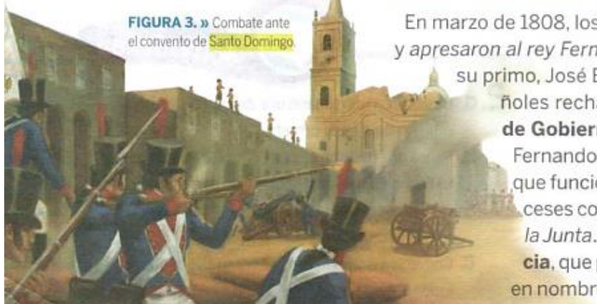
FIGURA 3. » Combate ante el convento de Santo Domingo

En marzo de 1808, los ejércitos napoleónicos invadieron España y apresaron al rey Fernando VII. En su lugar, Napoleón nombró a su primo, José Bonaparte, como rey de España. Los españoles rechazaron al nuevo rey y organizaron Juntas de Gobierno locales que gobernaban en nombre de Fernando VII. Eran coordinadas por la Junta Central, que funcionaba en Sevilla. En enero de 1810, los franceses conquistaron la ciudad de Sevilla y disolvieron la Junta . En su lugar, se formó el Consejo de Regencia , que pretendió gobernar a España y sus colonias en nombre del rey.